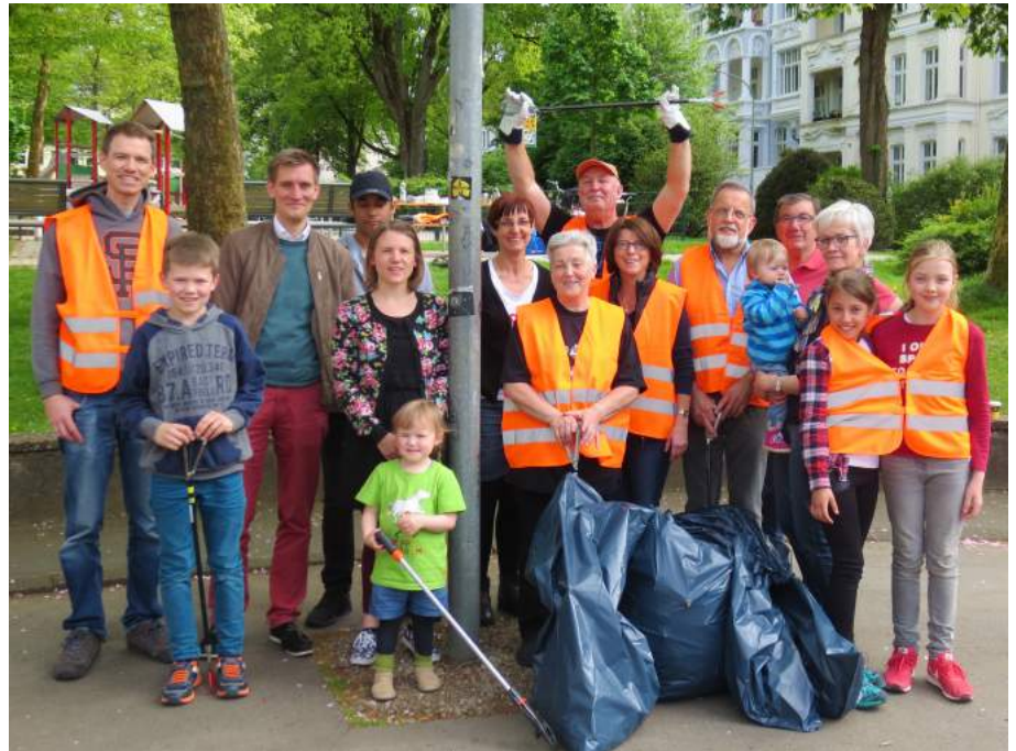
Viele fleißige Helfer haben am 27. April gemeinsam den Turnplatz gesäubert.